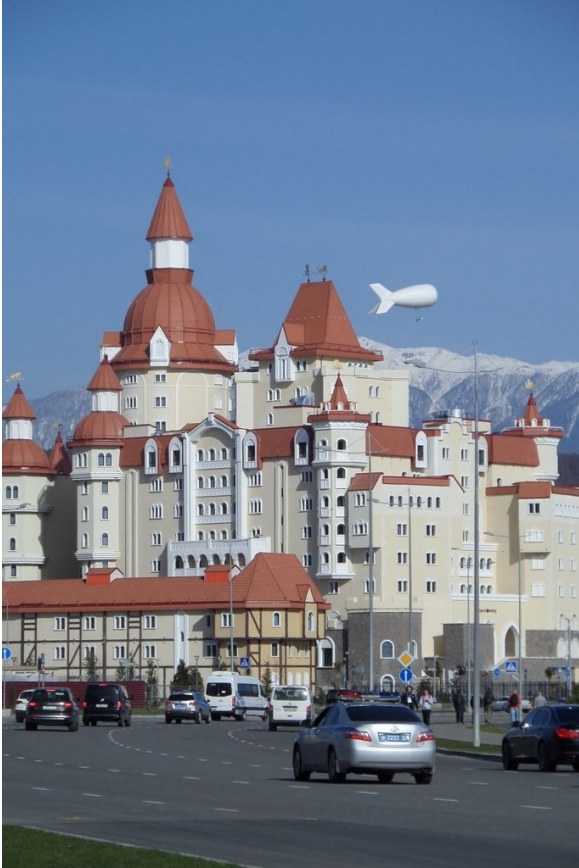
Иллюстрация 3: Конгресс-центр