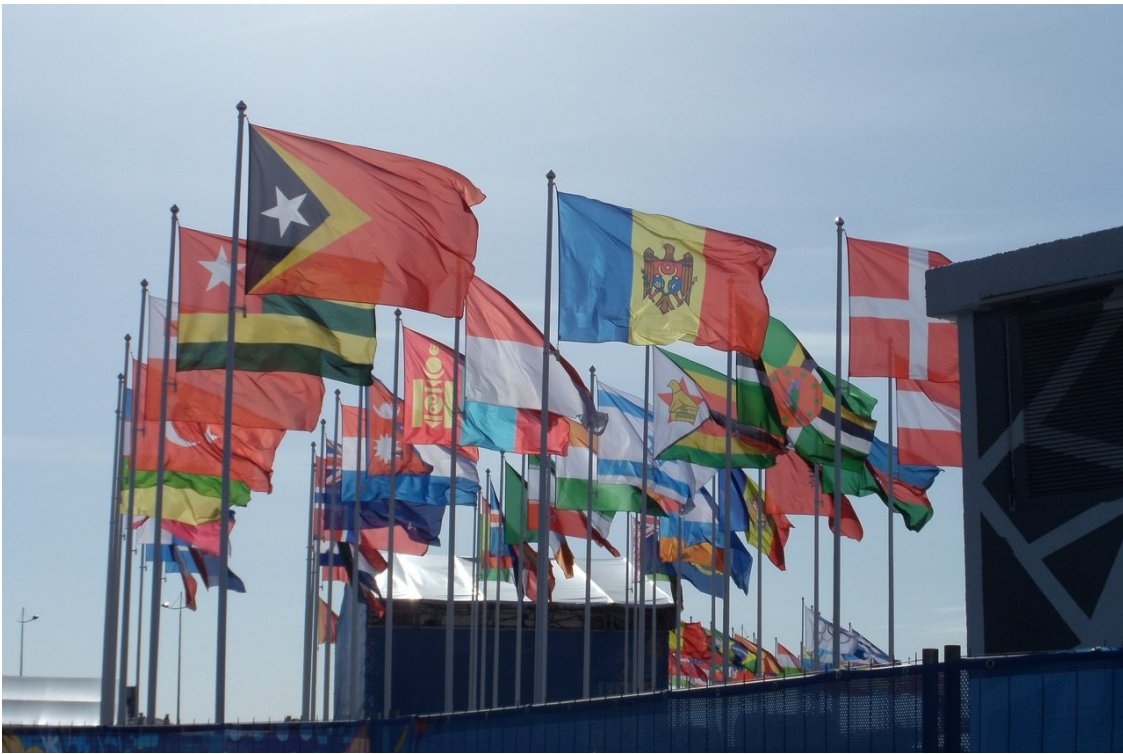
Иллюстрация 2: Флаги стран-участниц