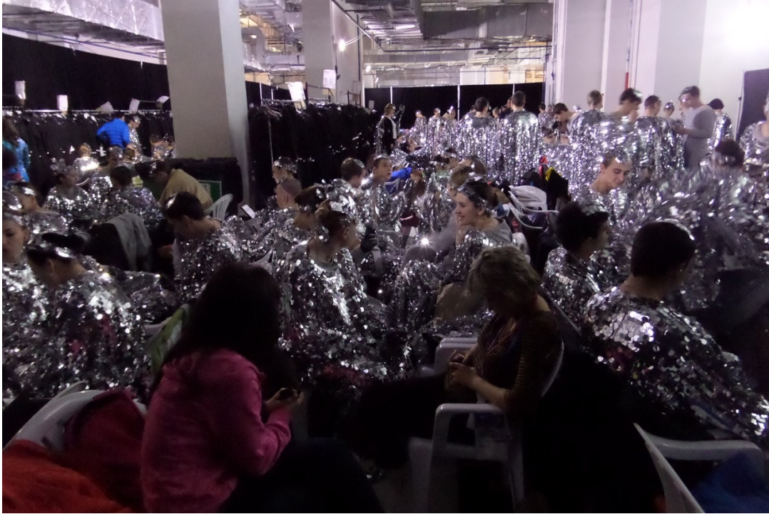
Иллюстрация 7: Подготовка к церемонии, гримерка