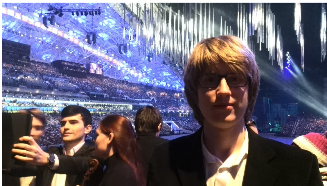
Иллюстрация 1: На стадионе перед началом церемонии