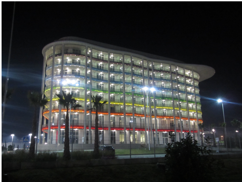
Иллюстрация 6: Гостиница для организаторов