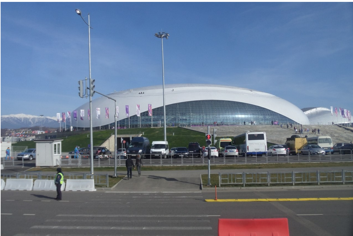
Иллюстрация 5: Большой стадион