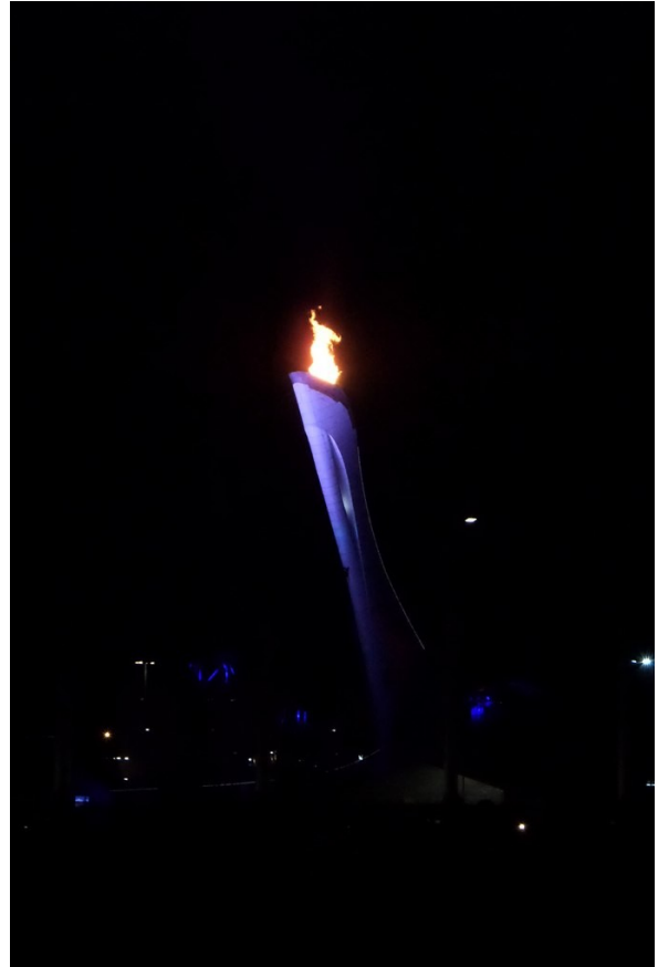
Иллюстрация 4: Олимпийский огонь